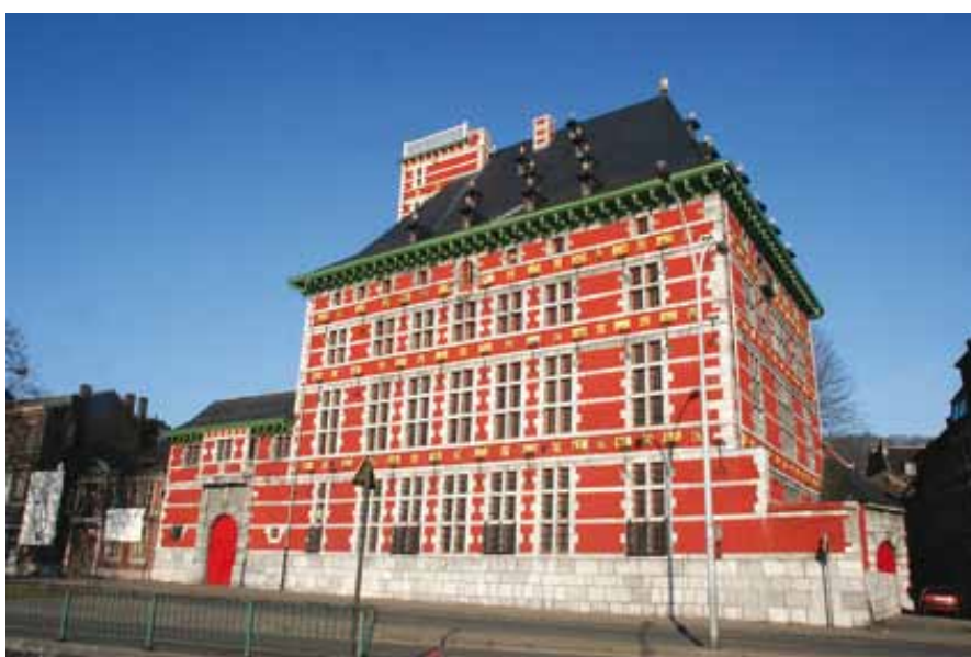
Palais Curtius, Grand Curtius

Le chiffre 8 a de nombreuses significations. En mathématique notamment, le chiffre 8 renversé ( \infty ) représente l'infini. Le 8 est aussi un symbole de l'alliance entre la terre et son modèle futur, entre la terre et l'humanité.