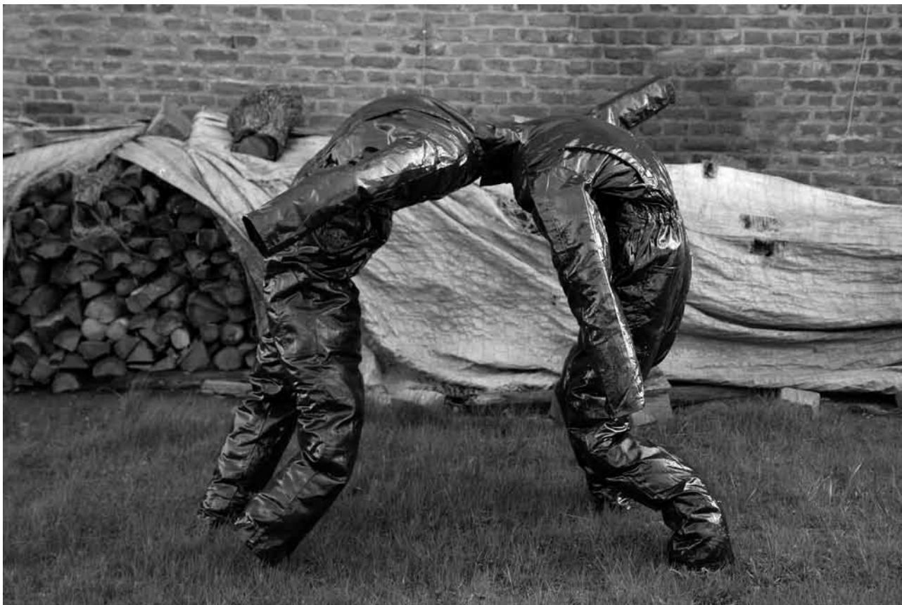
Pierre Devreux, Catharsis

Dans cette installation, 2 « OVERALL » se battent. Tête contre tête, ils disputent un affrontement musclé. Pourtant, il n'y a pas de geste de lutte : ils ne s'empoignent pas, ne se frappent pas, c'est juste leur « tête » qui, appuyées l'une contre l'autre, bataillent pour pousser l'adversaire. Placés sur une marelle, un des personnages occupe une case proche du « ciel » alors que l'autre est près de la case « terre ».