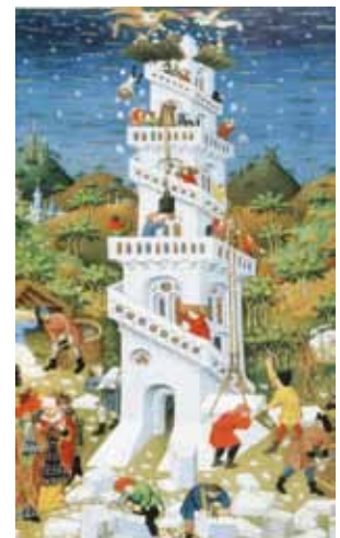
—● Maître de Bedford, Livre d'heures du Duc de Bedford, 15e siècle, British Library Londres.