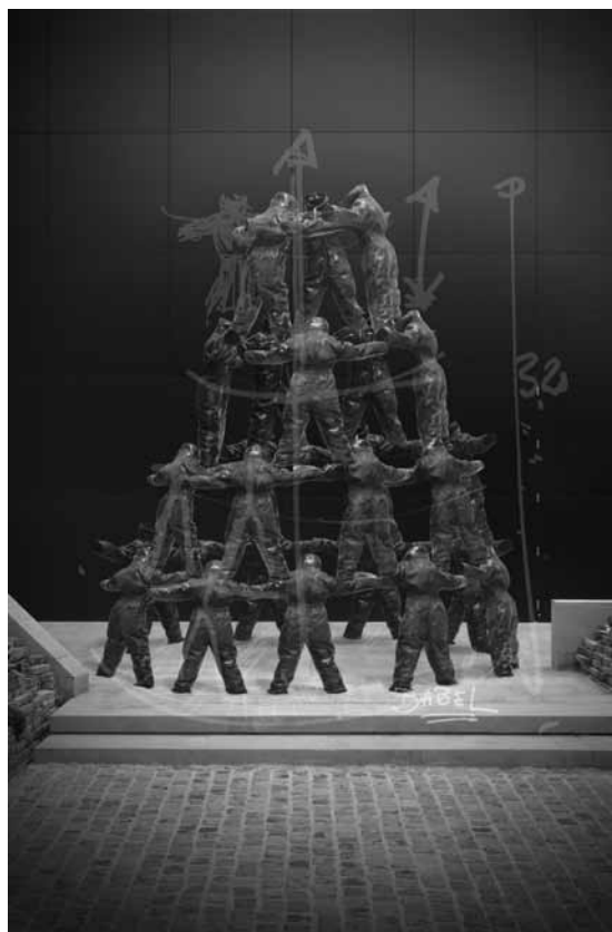
Pierre Devreux, Babel

Cette composition de Pierre Devreux fait référence à l'histoire de la Tour de Babel, racontée dans le livre de la Genèse.