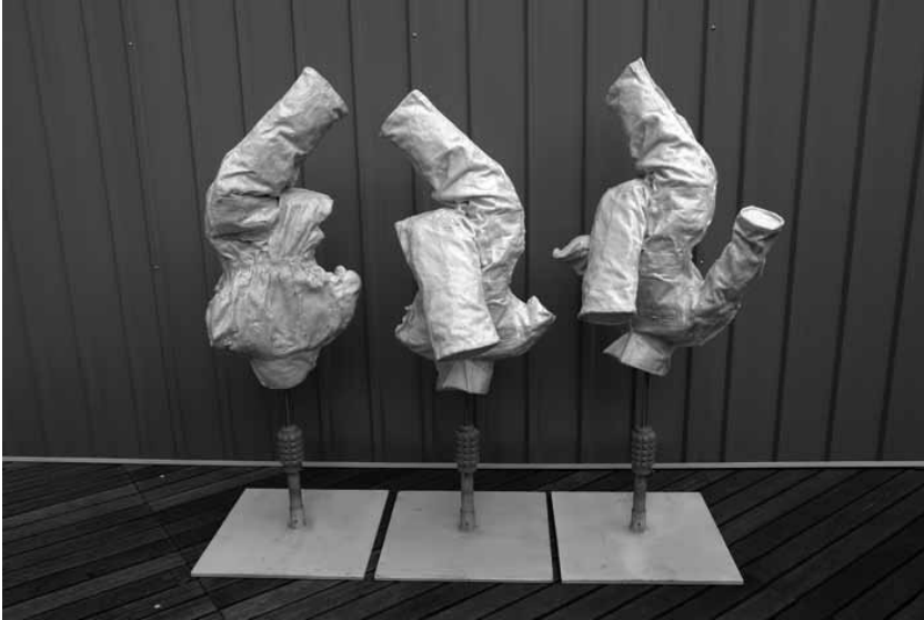
Pierre Devreux, Destruction © Pierre Devreux

Destruction présente 7 « OVERALL » posés sur des socles, comme des sculptures antiques. Ces « OVERALL » sont de petites dimensions, ce sont des enfants. Têtes en bas, comme renversés, ils sont perchés sur des mines antipersonnels. Ils représentent des enfants en souffrance, blessés par les mines. Un 8 e « OVERALL » assiste à la scène. Ce petit corps d'enfant doré danse. Il symbolise l'enfant insouciant, qui n'a pas conscience de la guerre.