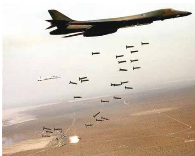
Bombes à sous munitions