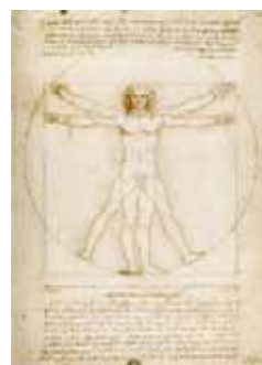
Léonard de Vinci, L'homme de Vitruve © alc-world.org

L'œuvre de Pierre Devreux, tout comme ce signe, est un appel au renversement des valeurs. L'œuvre invite à cesser de produire et utiliser des armes à sous-munition, c'est-à-dire à maintenir la paix. Elle veut renverser la situation actuelle : produire des armes, faire la guerre, essayer d'assurer la paix.