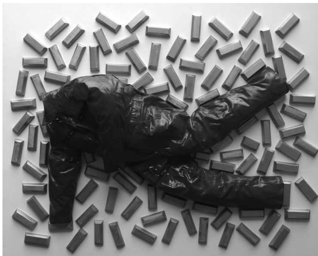
Pierre Devreux, Corps censurés et mutilés © Pierre Devreux

Dans cette installation, Pierre Devreux dénonce les priorités économiques liées à la guerre. Les intérêts financiers prennent souvent le dessus sur les priorités morales. La guerre représente un business grâce auquel certains s'enrichissent.