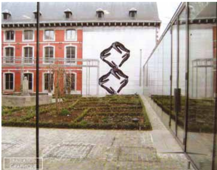
Pierre Devreux, Ré enchantement

L'œuvre Ré enchantement présente 8 « OVERALL » vus de profil et suspendus au mur de la résidence Curtius de manière à former le chiffre 8. Ce nombre est particulièrement symbolique (Cf. Supra). Il fait notamment allusion à l'infini donc au recommencement.