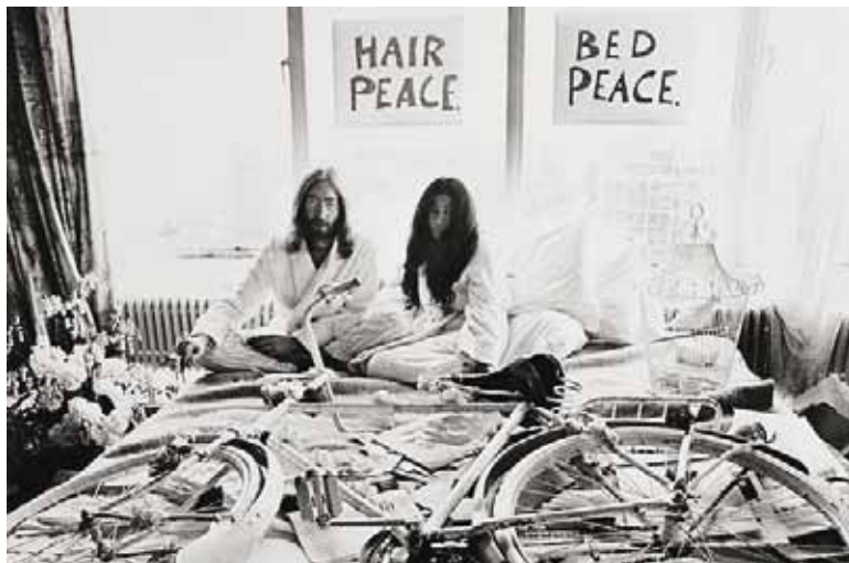
Nico Koster, Bed in for peace