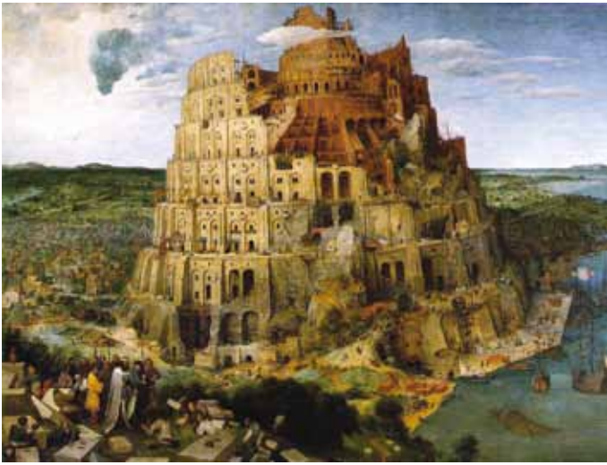
—● Pierre Brueghel l'Ancien, La Tour de Babel, 1563, Kunsthistorisches Museum de Vienne.

Le thème de la Tour de Babel a été illustré par d'autres artistes tout au long de l'histoire. Tu trouveras ci-dessous quelques exemples.