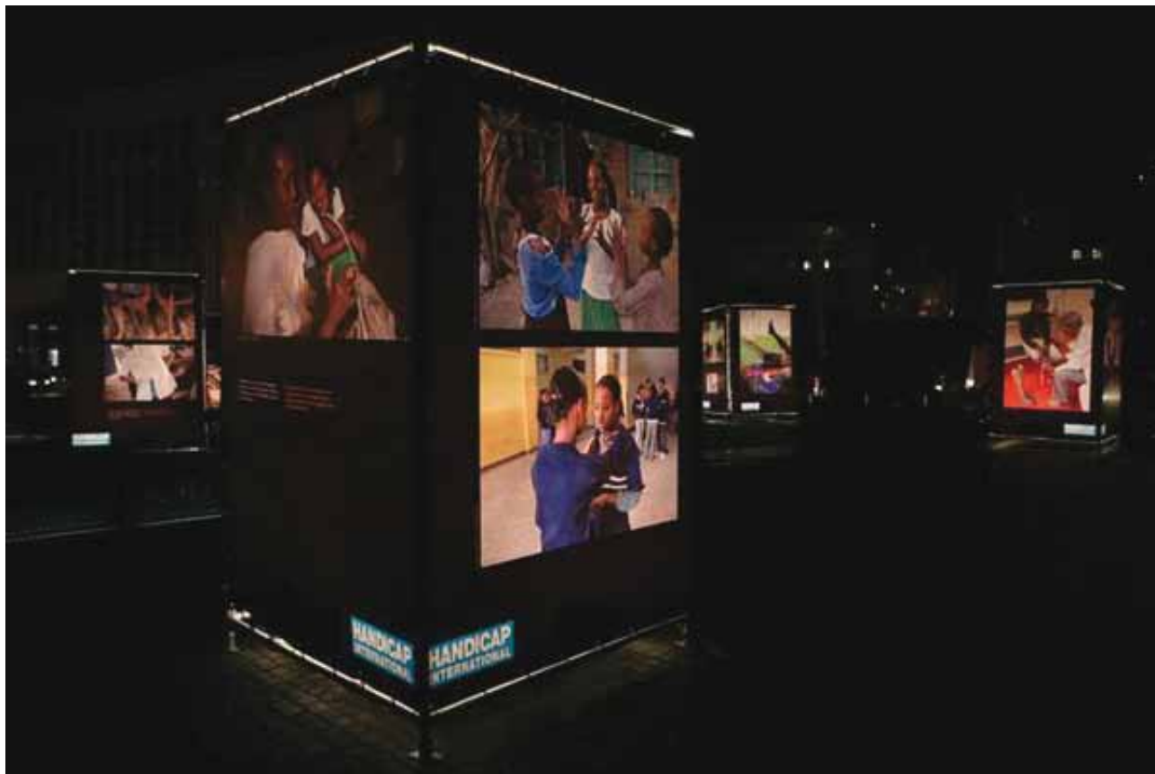
Fatal Footprint

Plus encore à découvrir sur le web : www.fatalfootprint.be