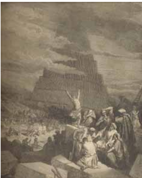
—● Gustave Doré, La Sainte Bible, La Tour de Babel, gravure, 1874.