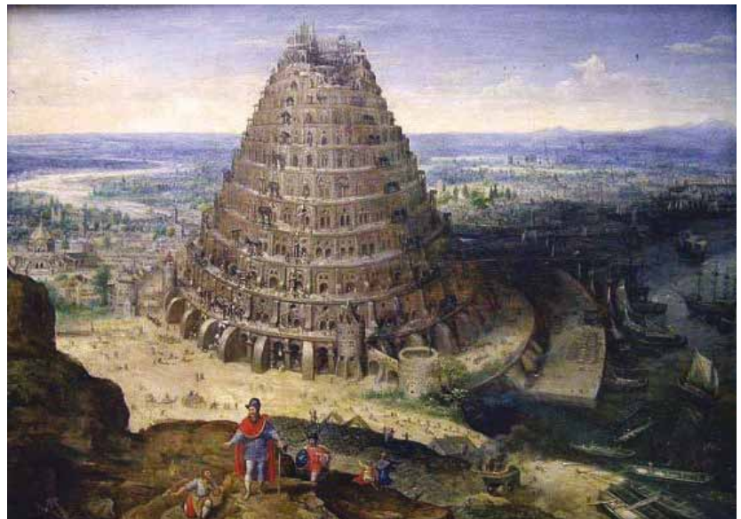
—● Lucas van Valckenborgh, La Tour de Babel, 1594, Musée du Louvre.