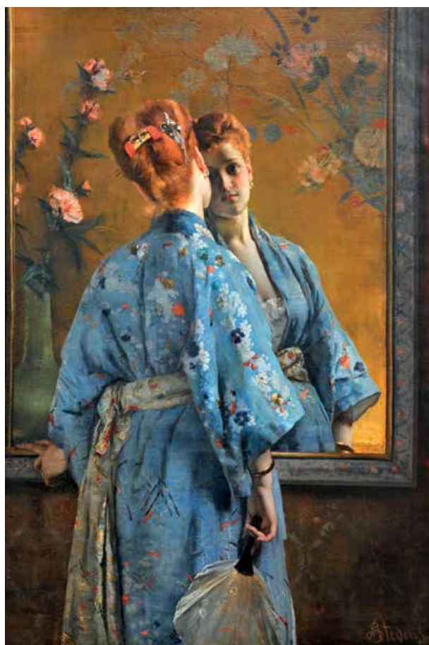
Alfred Stevens, La Parisienne Japonaise, huile sur toile, (1872-1874).

L'Art nouveau est un mouvement européen de la fin du 19 e Siècle qui rompt avec les styles historiques et s'inspire directement de la nature. Selon les régions ou les pays, l'esthétique Art nouveau peut-être plus naturaliste ou plus géométrique. Ses formes sinueuses et ondulantes reprenant plantes, fleurs, insectes ou autres animaux se retrouvent dans l'architecture, le mobilier, la verrerie, la céramique et les arts graphiques. La ligne est fluide et harmonieuse privilégiant l'élégance des courbes et la continuité des motifs pour créer un effet organique et vivant tandis que les couleurs, souvent inspirées de la nature, sont subtiles et nuancées. En rupture avec les styles historicistes et éclectiques, le mouvement vise à créer un art total dans lequel tous les aspects d'un objet ou d'un espace (structure, décoration, couleur, matière et fonction) sont conçus de manière cohérente et intégrée. Chaque création harmonise forme et usage transformant l'objet du quotidien ou l'architecture en œuvre artistique complète. Ainsi, l'Art nouveau dépasse la simple décoration pour proposer une approche globale et sensorielle de l'Art et de la Vie.