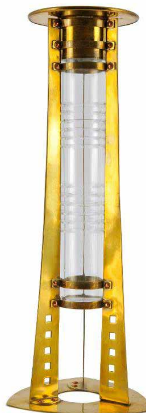
Création Gustave Serrurier-Bovy, cristal incolore soufflé, taillé, monture en laiton, Grand Curtius, Département du verre © Ville de Liège.

Gustave Serrurier-Bovy (1858-1910) est un architecte et décorateur belge, figure majeure de l'Art nouveau. Formé à Liège, il élabore un style associant lignes fluides, inspiration naturaliste et fonctionnalité. Il applique le principe d'art total en concevant des intérieurs cohérents où architecture, mobilier et objets décoratifs forment un ensemble harmonieux. En 1888, avec son épouse, il fonde la Maison Serrurier-Bovy produisant meubles, luminaires et objets décoratifs dont certains sont conçus pour être montés soi-même, préfigurant le meuble en kit. Parmi ses créations, ce soliflore, réalisé vers 1902, illustre, parfaitement, son répertoire décoratif ; le vase en cristal, soufflé et taillé au Val Saint-Lambert, est intégré dans une monture en laiton présentant une ligne et un motif géométrisant résolument novateurs. Serrurier-Bovy privilégie la simplicité des formes et l'innovation technique tout en rendant certaines de ses créations accessibles à un large public.