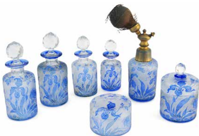
Création Léon Ledru, garniture de toilette "Orchidées", cristal incolore doublé bleu, soufflé, décor d'orchidées gravées à l'acide sur fond moiré, bouchons taillés, vers 1908, Grand Curtius, Département du verre © Ville de Liège.

L'originalité du style Art nouveau au Val Saint-Lambert réside dans la ligne résolument moderne insufflée, dès 1897, par Léon Ledru (Paris, 1855 – Liège, 1926). Ce dessinateur est engagé à la Cristallerie en 1888 et devient chef du Service des créations dès 1897. Ses compositions aux teintes audacieuses sont progressistes par leurs formes et leurs décors curvilignes dynamiques, dans la mouvance de l'esthétique d'architectes belges (Van de Velde). L'Exposition universelle de 1897 à Bruxelles révèle ses compositions inédites et originales. Parallèlement, il conçoit de multiples articles ornés de motifs floraux délicatement colorés qui sont gravés à l'acide.