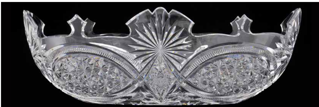
Coupe "Moscou", cristal incolore soufflé, décor richement taillé, vers 1908, Grand Curtius, Département du verre © Ville de Liège.

La pièce illustre une taille spécifique, caractérisée par des croisements très profonds et de larges facettes biseautées. Cette série, réputée pour sa complexité et sa qualité exceptionnelle, reflète l'excellence technique des Cristalleries liégeoises. Nommée « Moscou » probablement en référence à la Cour des Tsars, clients importants de l'époque, l'ensemble combine raffinement décoratif et maîtrise technique où chaque détail accentue le scintillement du cristal. La disposition harmonieuse des motifs et la précision des biseaux témoignent du savoir-faire des Maîtres-Tailleurs. La pièce illustre, également, l'influence de la clientèle aristocratique sur les créations de luxe.