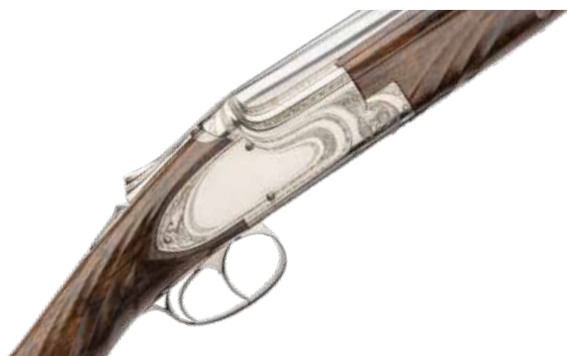
Fusil de chasse, 1939, FN, noyer et acier gravé par Funken, © Ville de Liège.

Le dimanche 20 septembre 2026 à 11h Prix : 5€