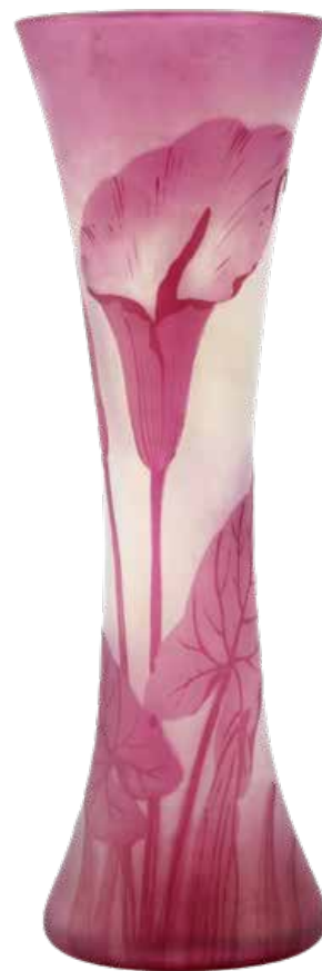
Vaas met aronskelkversiering, Cristalleries du Val Saint-Lambert, mei 1826, Grand Curtius, Afdeling Glas © Stad Luik.

Een opmerkelijke collectie, gekenmerkt door de creaties van illustere ontwerpers, glasblazers of 'designers', die het op internationaal niveau tot een van de belangrijkste glascollecties rekent.