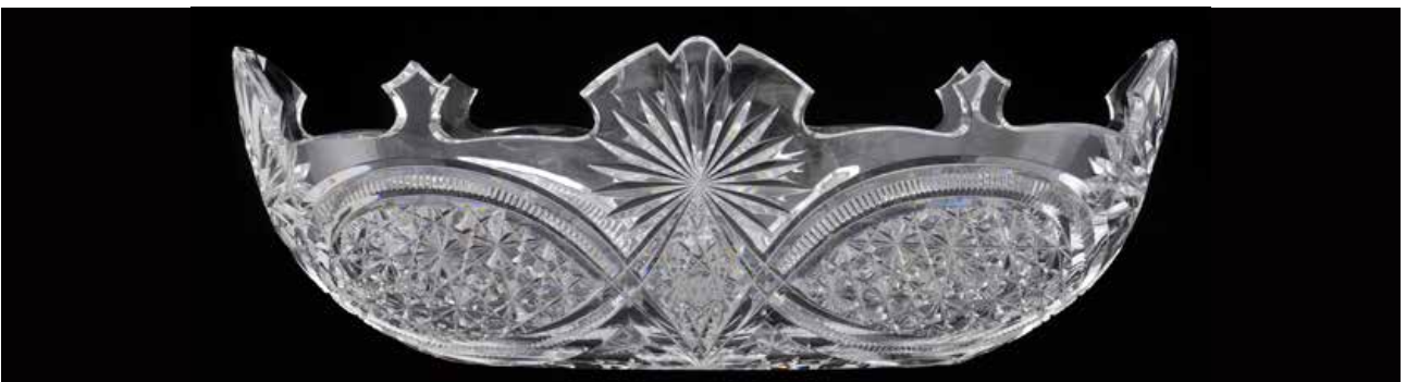
"Moskou"-beker, geblazen kleurloos kristal, rijkelijk geslepen decor, circa 1908, Grand Curtius, Afdeling Glas © Stad Luik.

Het stuk illustreert een specifieke slijpvorm, gekenmerkt door zeer diepe kruisingen en brede, afgeschuinde facetten. Deze serie, bekend om haar complexiteit en uitzonderlijke kwaliteit, weerspiegelt de technische uitmuntendheid van de Luikse kristalfabrieken. De serie, die waarschijnlijk "Moskou" werd genoemd naar het hof van de tsaren, belangrijke klanten uit die tijd, combineert decoratieve verfijning met technisch vakmanschap, waarbij elk detail de schittering van het kristal accentueert. De harmonieuze opstelling van de motieven en de precisie van de schuine randen getuigen van het vakmanschap van de meester-slijpers. Het stuk illustreert ook de invloed van de aristocratische klantenkring op de luxe creaties.