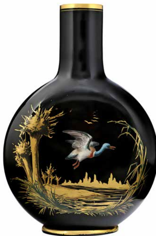
Hyalite-vaas, ondoorzichtig geblazen zwart glas, landschapsdecor in goud geschilderd met geëmailleerde eend, ca. 1880, Grand Curtius, Afdeling Glas © Stad Luik.

De ontdekking van de kunst uit het Verre Oosten, de organisatie van wereldtentoonstellingen en de aanwezigheid van winkels gewijd aan oosterse of oosters geïnspireerde kunst bevorderden vanaf de jaren 1880 de vervaardiging van artikelen met een vernieuwende esthetiek, gekenmerkt door de Japanse kunst. Deze hyalietvazen (naar een oopaal-soort), meestal van zwart glas, zijn voorzien van een verguld decor dat met verf is geaccentueerd en vertonen Japanse motieven (geisha's, landschappen).