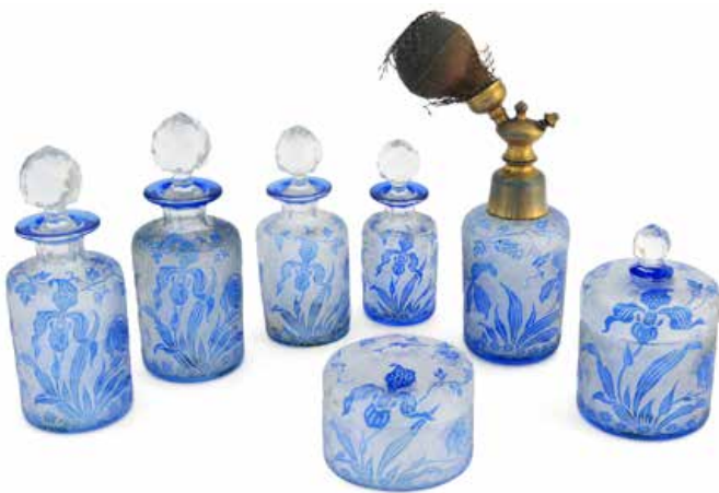
Ontwerp van Léon Ledru, toiletgarnituur "Orchidées", kleurloos kristal met blauwe binnenlaag, geblazen, decor van met zuur geëtsde orchideeën op een moiré-achtergrond, geslepen stoppen, circa 1908, Grand Curtius, Afdeling Glas © Stad Luik.

De originaliteit van de art-nouveaustijl in Val Saint-Lambert ligt in de uitgesproken moderne stijl die vanaf 1897 door Léon Ledru (Parijs, 1855 – Luik, 1926) werd geïntroduceerd. Deze ontwerper trad in 1888 in dienst bij de Cristallerie en werd vanaf 1897 hoofd van de ontwerpafdeling. Zijn composities met gedurfde kleuren zijn vooruitstrevend door hun vormen en dynamische, gebogen decoraties, in de lijn van de esthetiek van Belgische architecten (Van de Velde). Op de Wereldtentoonstelling van 1897 in Brussel werden zijn vernieuwende en originele ontwerpen onthuld. Tegelijkertijd ontwierp hij talrijke artikelen versierd met subtiel gekleurde bloemmotieven die met zuur waren gegraveerd.