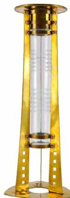
Ontwerp: Gustave Serrurier-Bovy, kleurloos geblazen en geslepen kristal, messing montuur, Grand Curtius, Afdeling Glas

Gustave Serrurier-Bovy (1858-1910) was een Belgische architect en binnenhuisarchitect, een vooraanstaande figuur binnen de art nouveau. Hij volgde zijn opleiding in Luik en ontwikkelde een stijl die vloeiende lijnen, naturalistische inspiratie en functionaliteit combineerde. Hij paste het principe van de totale kunst toe door samenhangende interieurs te ontwerpen waarin architectuur, meubilair en decoratieve voorwerpen een harmonieus geheel vormden. In 1888 richtte hij samen met zijn echtgenote het Maison Serrurier-Bovy op, dat meubels, verlichting en decoratieve objecten produceerde, waarvan sommige ontworpen waren om zelf in elkaar te zetten, een voorloper van de meubelpakketten. Een van zijn creaties, deze soliflore, vervaardigd rond 1902, illustreert perfect zijn decoratieve repertoire; de kristallen vaas, geblazen en geslepen in Val Saint-Lambert, is geïntegreerd in een messing montuur met een uitgesproken vernieuwende lijnvoering en geometrisch motief. Serrurier-Bovy geeft de voorkeur aan eenvoudige vormen en technische innovatie, terwijl hij sommige van zijn creaties toegankelijk maakt voor een breed publiek.