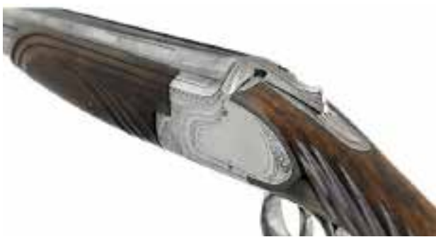
Jachtgeweer, 1939, FN, notenhout en staal gegraveerd door Funken, © Stad Luik.

Inschrijvingen voor de activiteiten op www.grandcurtius.be/fr/votre-visite/billetterie